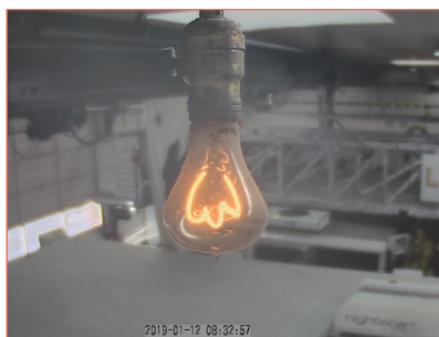
Figura 5. Bombilla con filamento de carbono que se mantiene encendida en Livermore.

Realmente, hay historias tan fascinantes que es imposible contar en un artículo, y tampoco es nuestra pretensión hacerlo, pero sí sembrar la curiosidad por indagar y sumergirse en las intrigas de la tabla de Mendeléiev. Aun así, queremos dar una pincelada sobre otro elemento con nombre de ciudad, el livermorio, en honor a la ciudad de Livermore (California). Allí se encendió, el 18 de junio de 1901, una bombilla con filamento de carbono (fig. 5) que lleva encendida desde entonces ininterrumpidamente, a excepción de dos