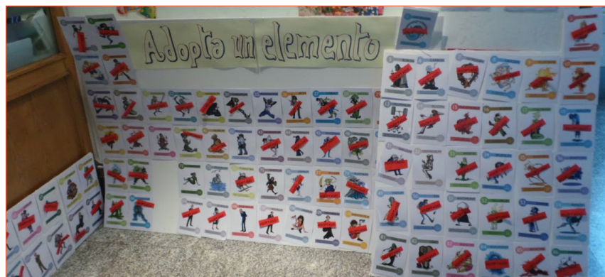
Figura 1. Póster «Adopta un elemento», elaborado por los alumnos.

Durante muchos años, la enseñanza por parte del profesorado y, por tanto, el aprendizaje del sistema periódico se ha basado